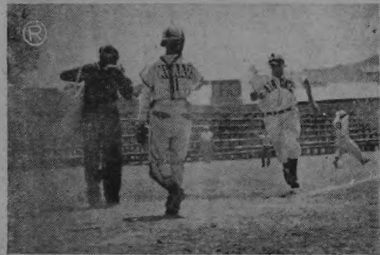
Gigantes se anota una carrera más en el match que al Nueve Estrellas

1955. Todo ello está haciendo que Limón y sus barras estén gozando de cartel de lugares de primera para el turismo en estos días de Semana Santa. Las costas del Atlántico Tico serán teatro de escenas de emoción. Igual cosa en los mares del Pacífico Tico con los que van a tomar parte en el primer torneo nacional de la pesca del pez vela y el Marlin, que para asombro del Comité Organizador, ha superado todos los cálculos previstos el número de inscripciones que ya pasan de sesenta concursantes. Ya han registrado más de 10 velas y otros tantos dorados. Hasta hoy ni un wahoo ni un atún. Pero en esta semana son olas las que salen de Puntarenas, Quepos, Golfito y Palmar Sur.