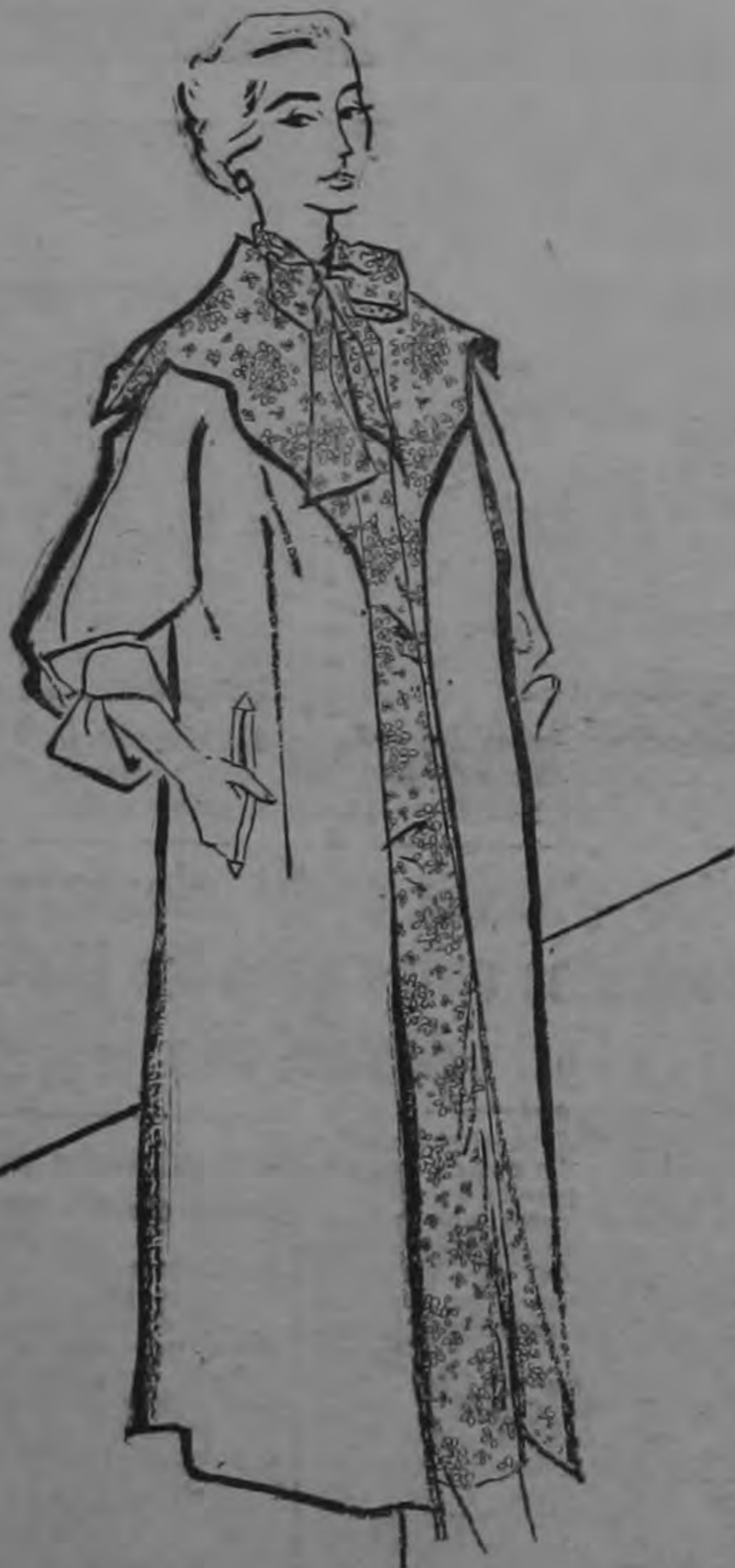
FASHION LEAGUE - 72-26-54

He aquí un abrigo, creación de Vera Maxwell, de inspiración Irlandesa. Es de franela de lana, con ancho cuello y forro que hace juego con el traje de seda estampada con que se usa. Las mangas, irés cuártos, tienen puños estrechos y suaves.