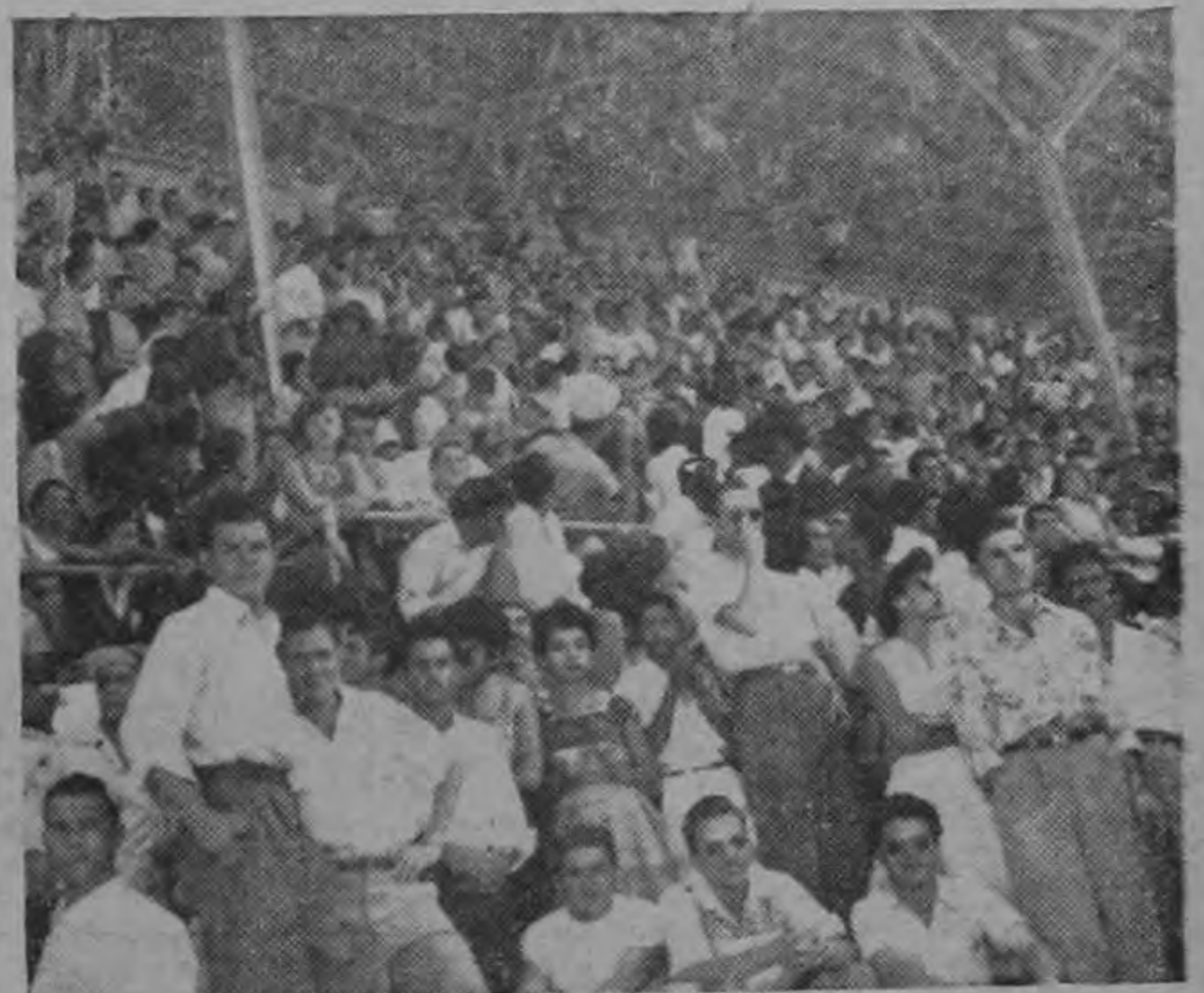
Vista parcial de la enorme concurrencia que asistió el domingo al Estadio Nacional para presenciar el partido Saprissa-Heredia.

Los jugadores del Herediano celebrarán en Barranca su triunfo sobre Saprissa, habiendo sido invitados a la fiesta tres miembros del Círculo de Periodistas y Locutores Deportivos.