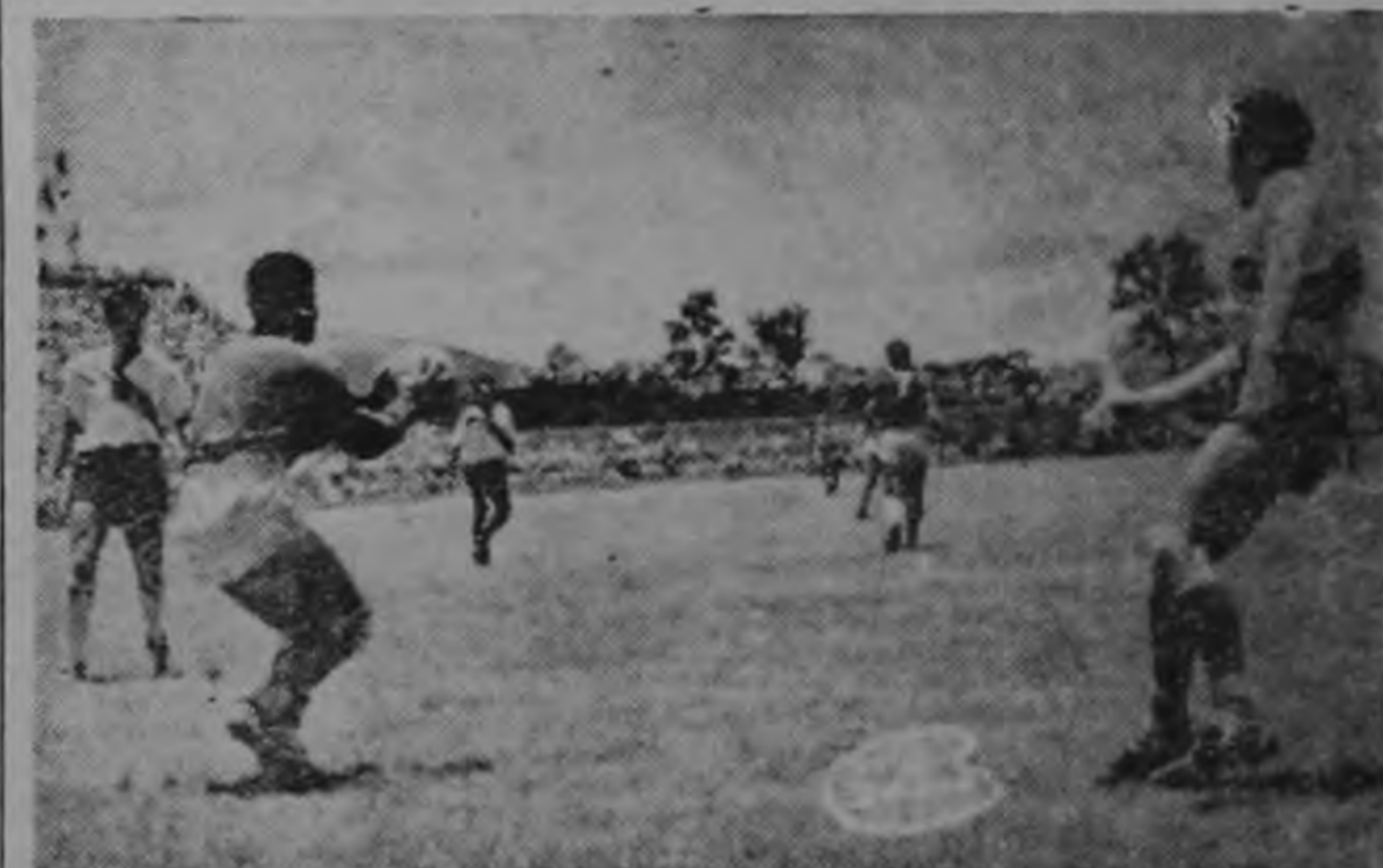
Dos intervenciones del arquero del Herediano, Cholo Campos, en el match con Saprissa, que ganaron los primeros por el score de 4 goles a 2.