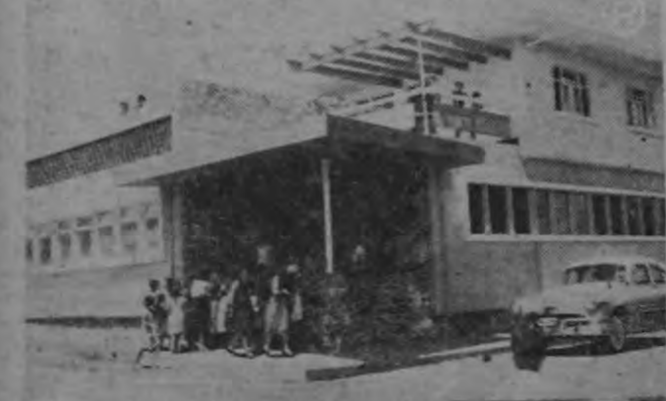
Obsérvense las líneas modernas y la fachada lujosa del dispensario del Seguro Social inaugurado en Juan Viñas el día domingo próximo pasado. El costo de esa obra asciende a varios millones de colones y se considera que reúne todas las condiciones técnicas para dar un eficiente servicio a los trabajadores que harán uso de él.

Lo estimulante de las cifras publicadas es que, a pesar de las convulsiones políticas causadas por el régimen procomunista de Arbenz, Guatemala pudo conservar un balance de comercio favorable de más de nueve millones de quetzales y al mismo tiempo aumentó su volumen de comercio sobre el año de 1953 en seis y medio millones.