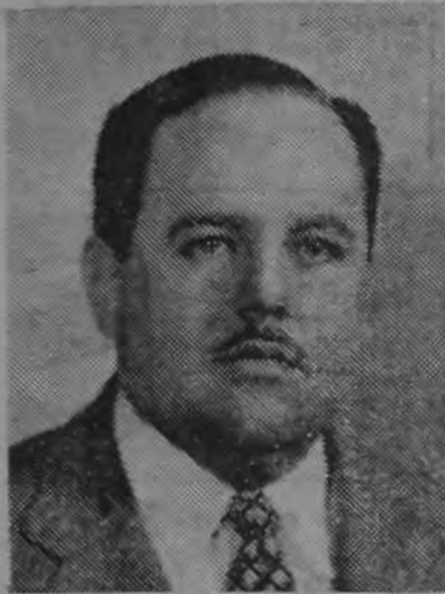
Excmo Sr. Don Mario Esquivel, Ministro de Relaciones Exteriores

El domingo se esperan en Costa Rica, de regreso de su viaje a Sud América, al Excmo señor don Mario Esquivel, Ministro de Relaciones Exteriores y a su bella señora esposa Viviana Volio de Esquivel, quienes han sido objeto de múltiples agasajos en el exterior. LA REPUBLICA se complace en adelantarles su afectuoso saludo de bienvenida.